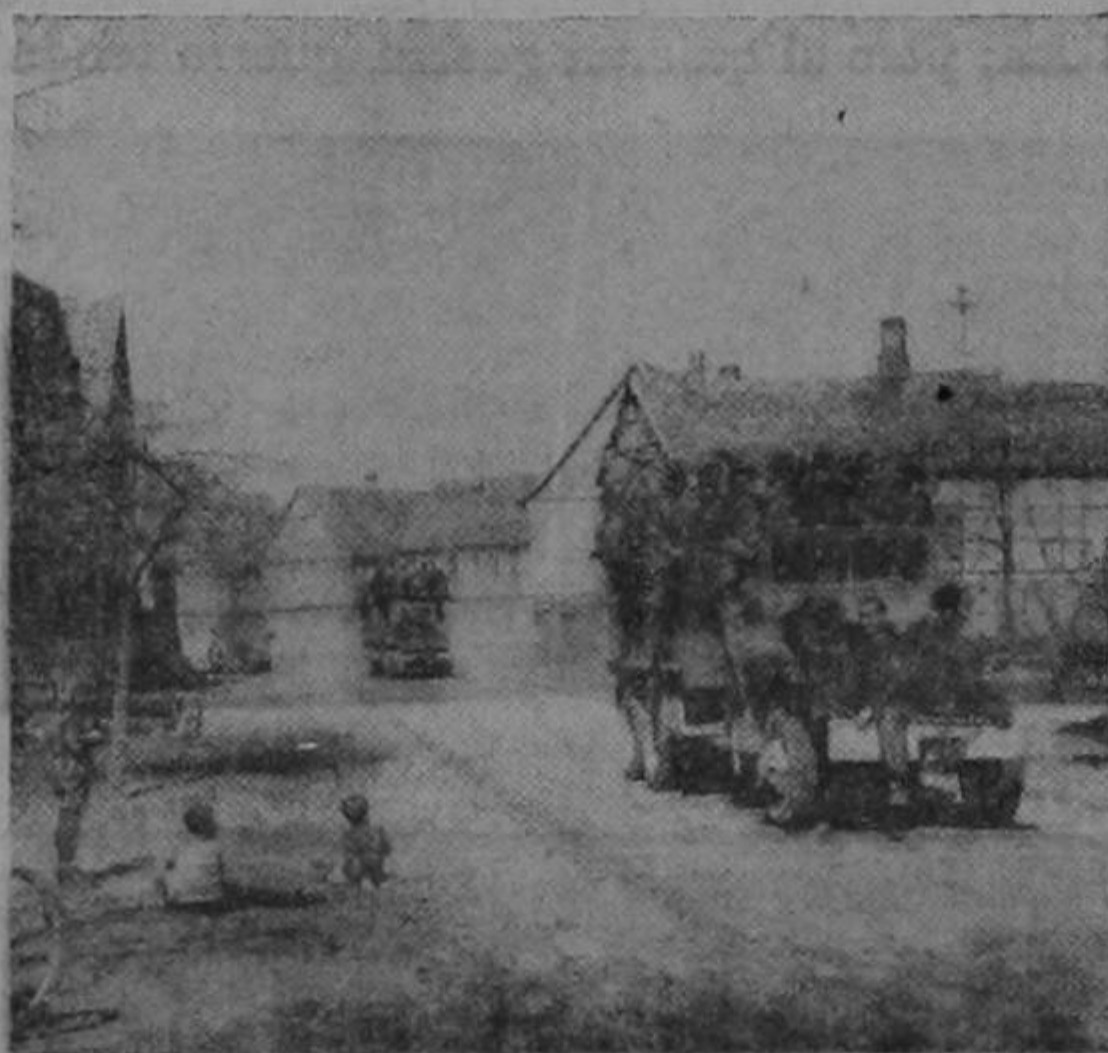
En una aldea alemana tres niños interrumpen su juego callejero para mirar los camiones cargados de prisioneros alemanes que se dirigen a los campos de concentración. El número de cautivos tomados por los estadounidenses es tal que para su transporte se hace necesario aprovechar hasta el parachoques de los vehículos. En contrario a 1918, esta vez los alemanes ven por sí mismos la derrota de sus ejércitos.