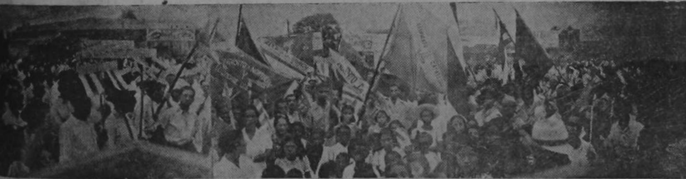
Arriba puede verse un aspecto parcial de la apretada concentración de masas que realizó la C. T. C. R. y Vanguardia Popular en la ciudad de Limón. Miles de obreros y agricultores de la zona atlántica reafirmaron el 1º de Mayo su decisión de transformar a Costa Rica apoyando al presidente Picado para que éste aplique en su totalidad el programa de gobierno.