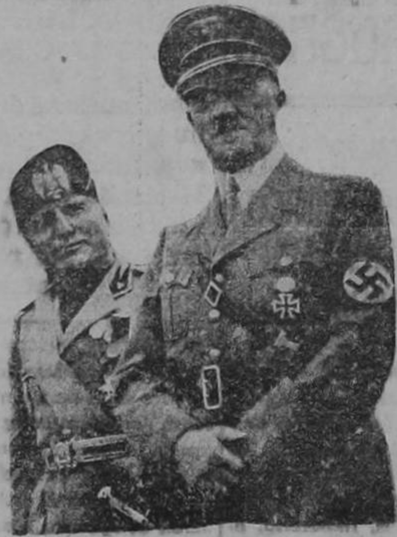
Hitler y Mussolini cuando soñaban en dominar el mundo entero. ¡DOMINABAN! Ambos murieron cobardemente. Falta Franco... y no se escapará!

de las ambiciones de esos dos hombres, que a su vez se convierten en instrumentos del imperialismo.