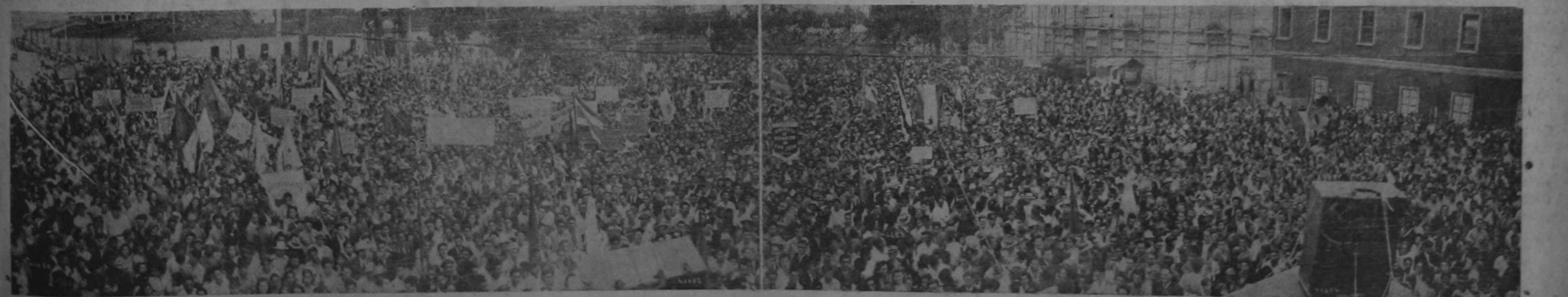
De costado a costado, las cuatro manzanas que forman la plaza España, se vieron repletas por una monstruosa masa humana de costarricenses que dieron a entender elocuentemente la fortaleza irresistible de la organización obrera en Costa Rica. Mejor que nuestras palabras habla esta gráfica de la manifestación del 1º de Mayo en San José. Fue un golpe tremendo en las derrumbadas esperanzas antipatrióticas de la reacción.