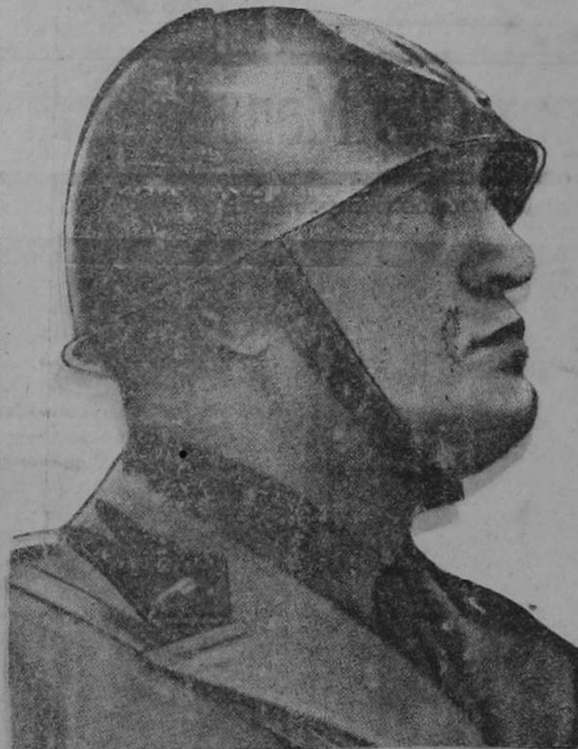
El payaso italiano, el César de serrín, murió pidiendo que no lo mataran; por favor.